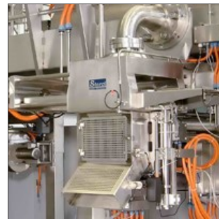
Vue tête circulaire