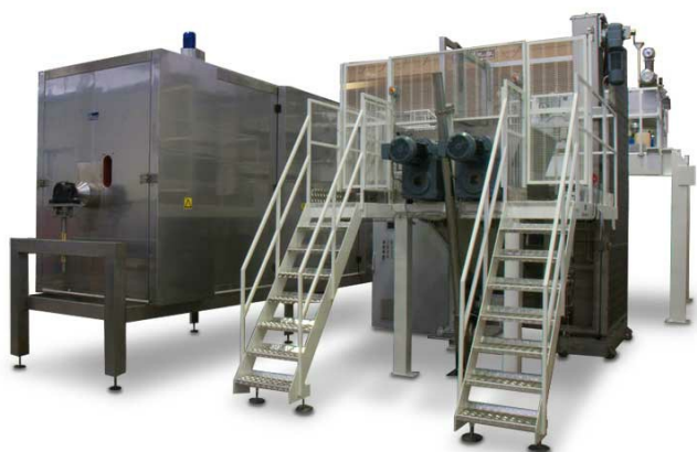
REC 2000 D/AUT