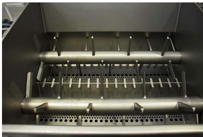
Doppio albero della vasca