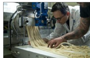
Detalle producción busiata