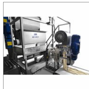
Prensa V90-250 G