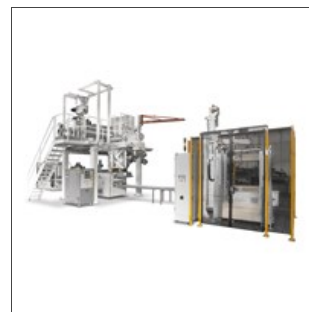
Pressa 180.1 su linea Pasta Corta