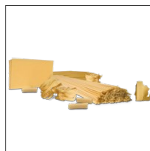
Séchage pour tous les formats de pâtes