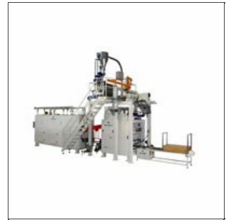
Configuration 130.1-350/1120 TV pour pâtes longues