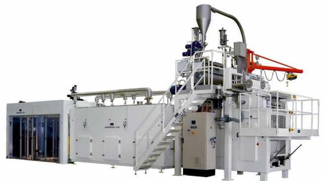
Configuration 130.1.1120/1 TV/L pour pâtes longues