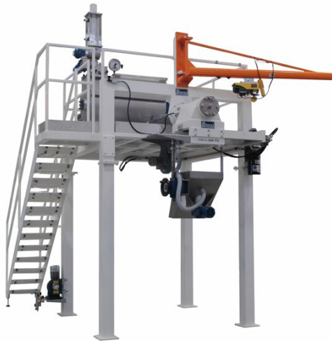
Presse automatique mod. 130.1.350 TV/C