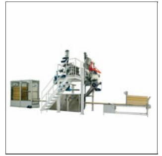
Configuration 130.1.350 TV/C pour pâtes courtes (nids et lasagnes)