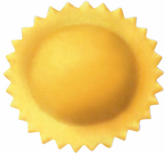
■ Raviolos redondos a doble hoja