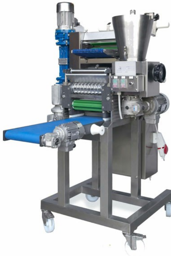
■ Máquina de ravioles RC 250-300 AR