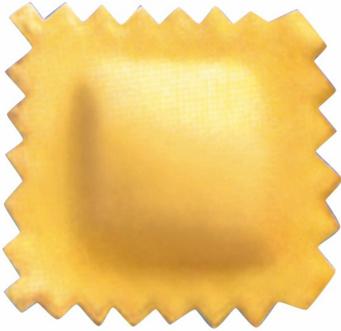
■ Raviolos cuadrados a doble hoja