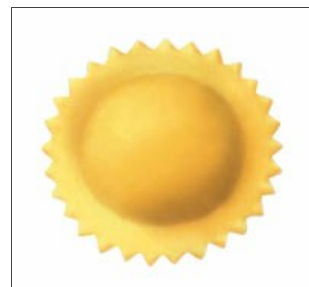
Raviolo tondo a doppia sfoglia