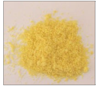
Produit broyé homogène