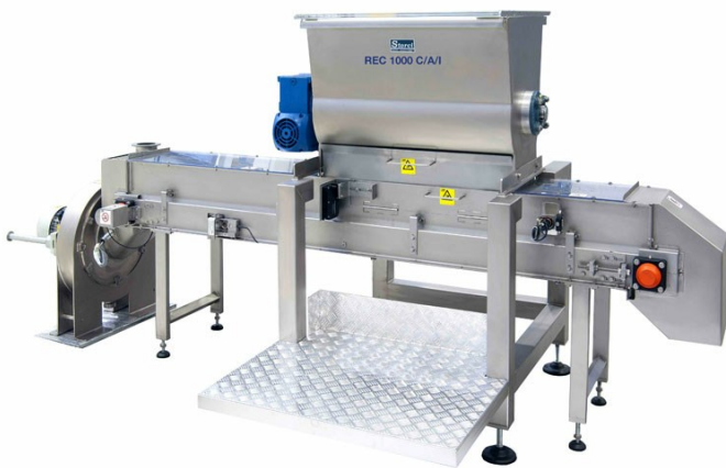
■ Rec 1000 C/A/