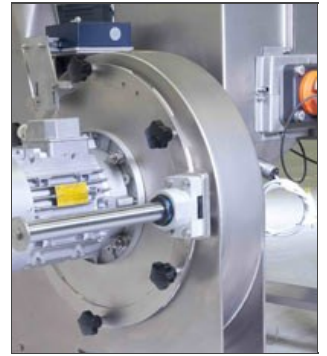
Détail du broyeur ouvrable