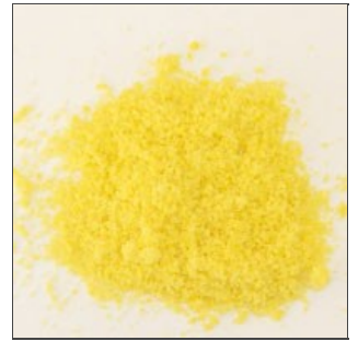
Produit broyé homogène