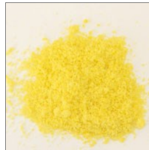
Produit broyé homogène