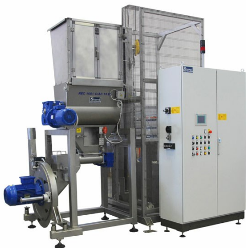
REC 1001 C/A/I