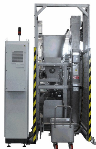
Système de chargement wagonnets