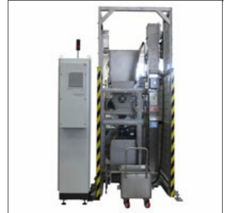
Système de chargement wagonnets