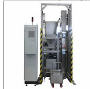
Système de chargement wagonnets