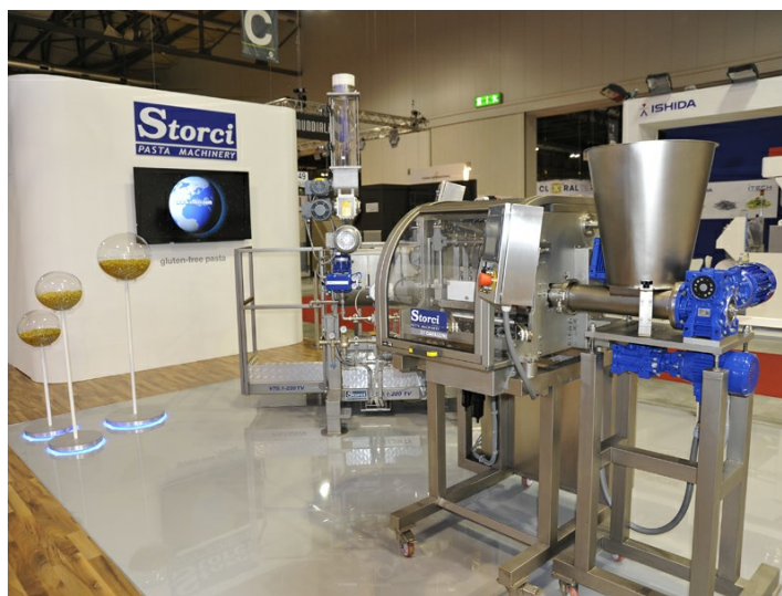
Tortellinatrice automatica alla fiera Ipack Ima 2015