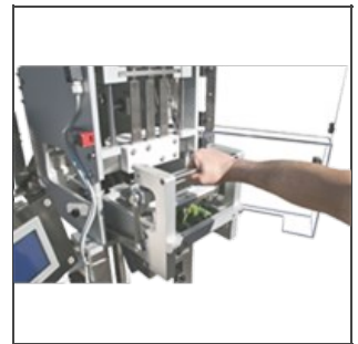
Cambio formato fácil y rápido