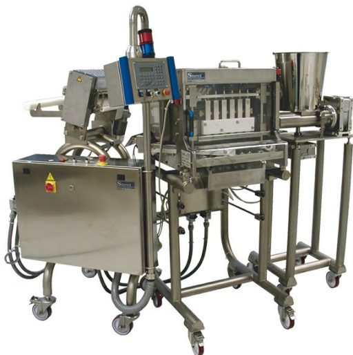
Modeladora automática para tortellinis