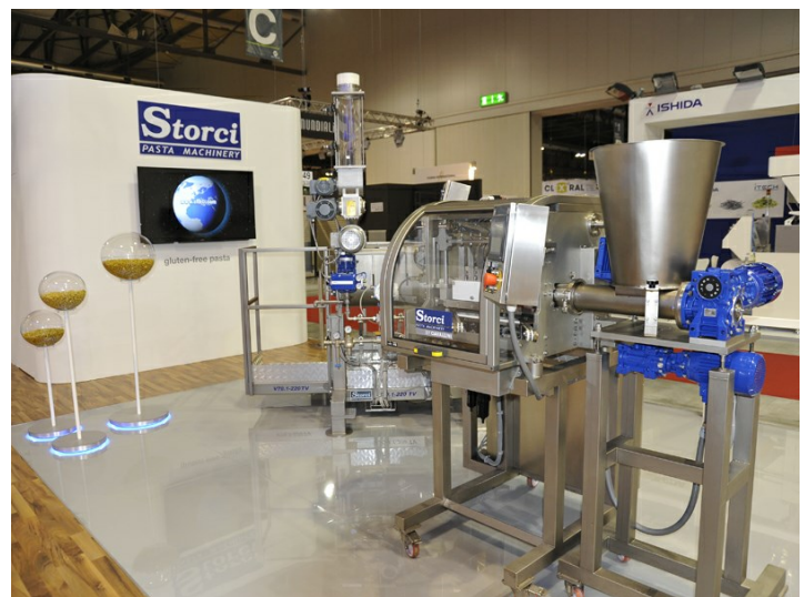
Modeladora automática en Ipack Ima 2015