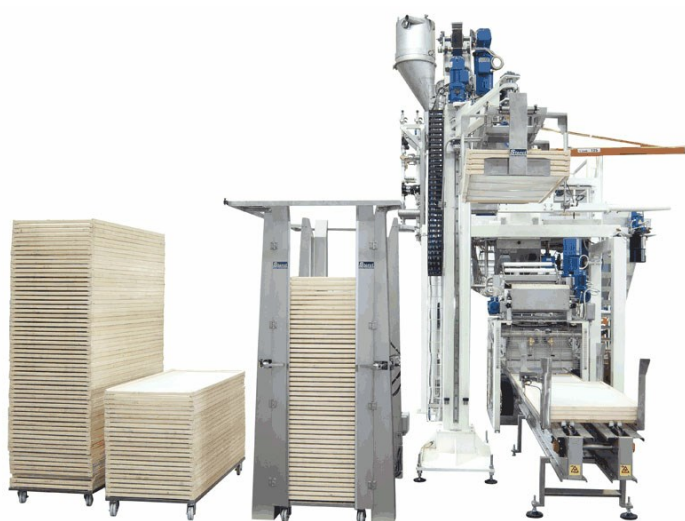
Déempileur de plateaux Robo XD