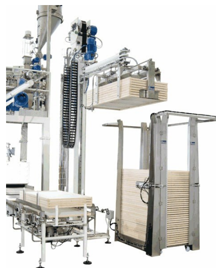
Empileur de plateaux Robo-XI