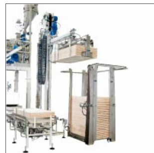
Empileur de plateaux Robo-XI