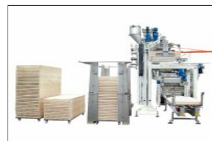
Déempileur de plateaux Robo XD