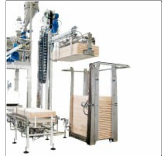
Apilador bastidoras Robo XI