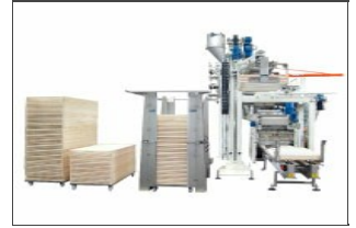
Desempilador bastidoras Robo XD

Epecífico para todas las líneas Storci e ideales para otras líneas.