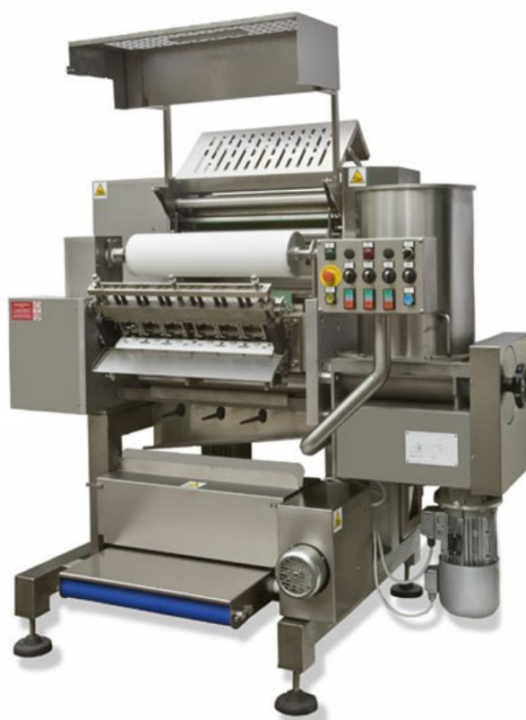
Raviolatrice R 540 C