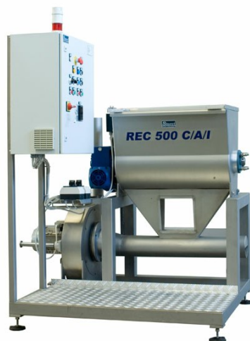
■ Rec 500 C/A/I