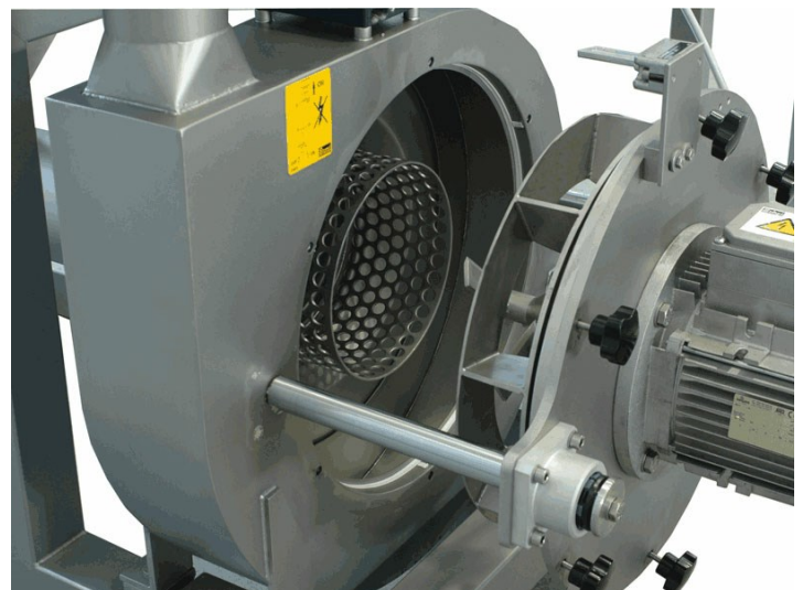
■ Détail du broyeur ouvrable