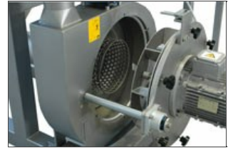
Détail du broyeur ouvrable