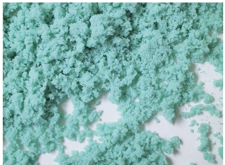
■ Pâte avec colorant (bleu de méthylène)