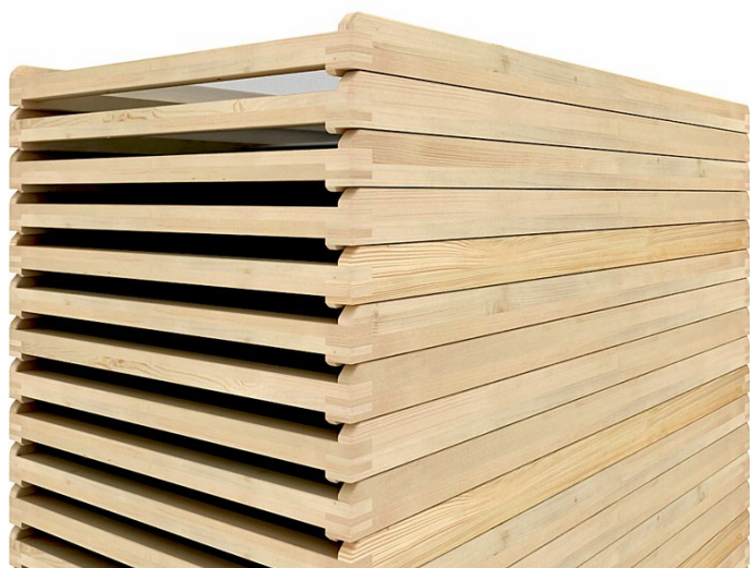
■ Bastidores en madera