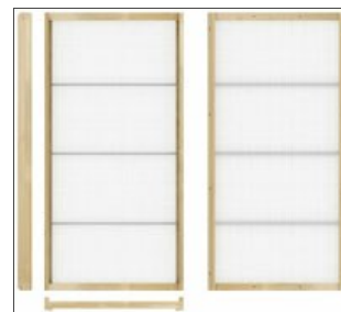
Plateaux en bois