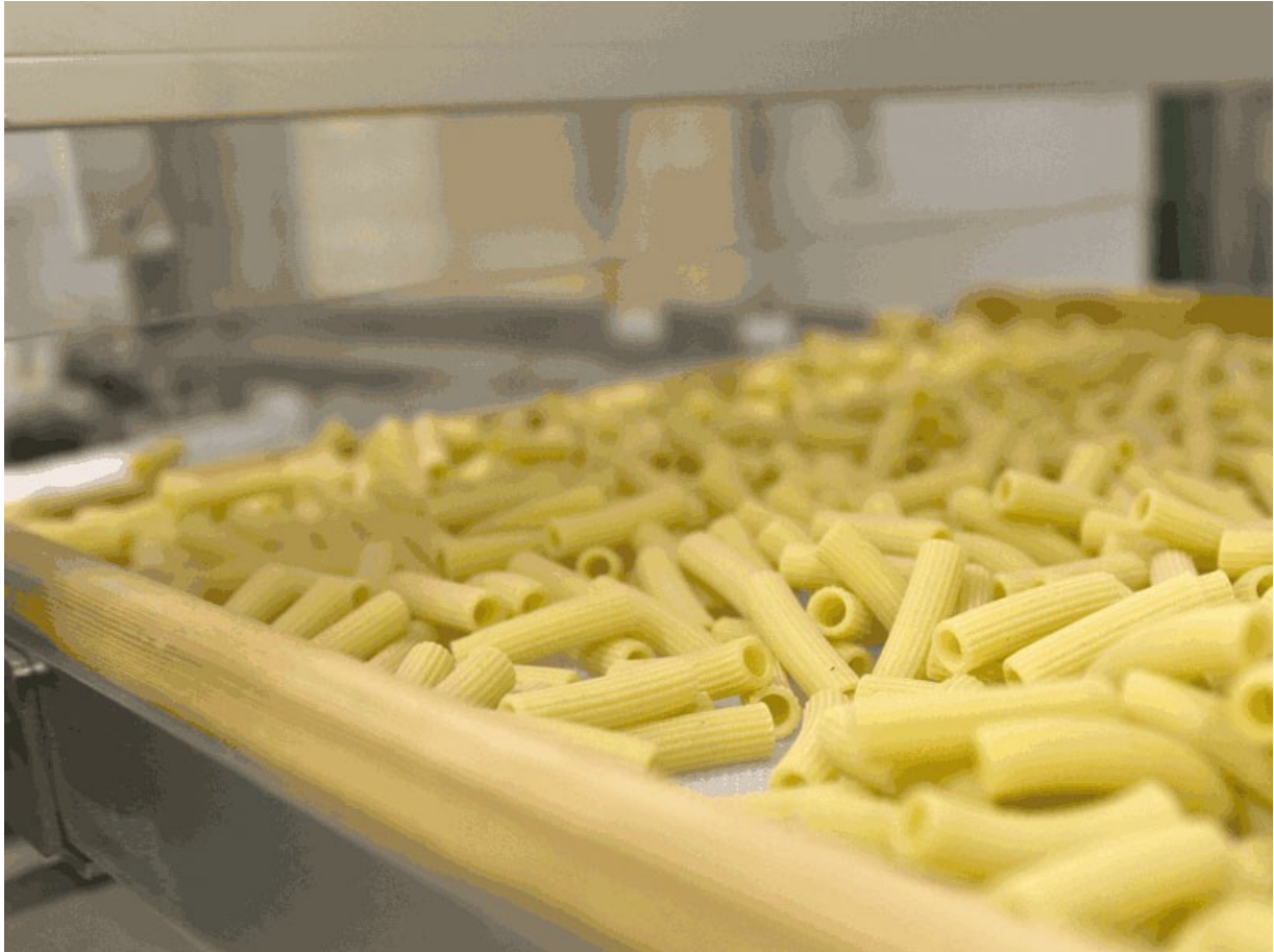
■ Détail du plateau en bois avec pâtes