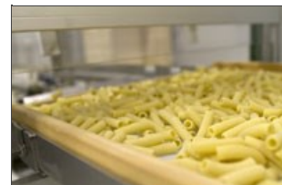
Détail du plateau en bois avec pâtes