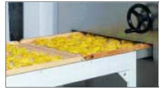
Particular nidos en la entrada del pre-secador