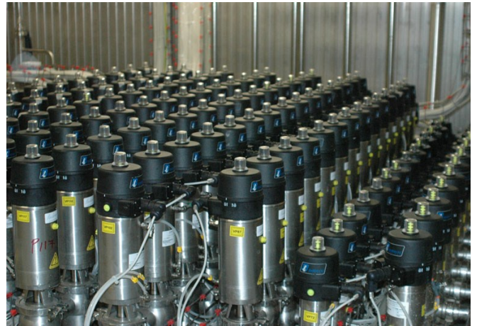
■ Gruppo di distribuzione