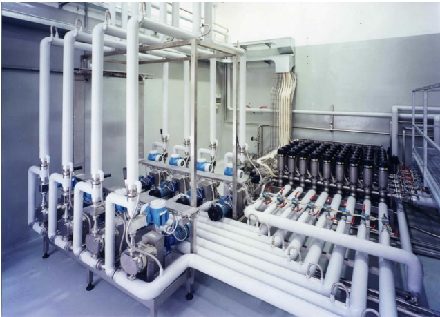
■ Locale impianto uovo