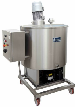
■ Réservoir réfrigéré pour les œufs liquides