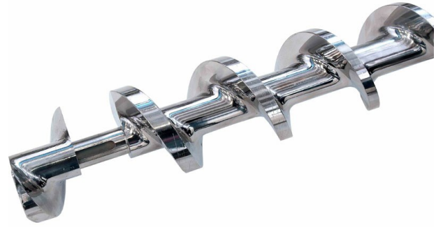
■ Tornillo de compresión cerrado