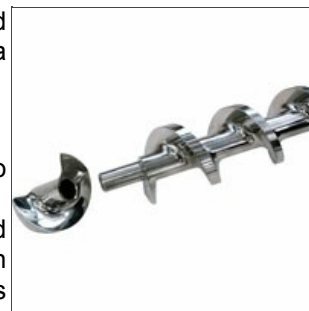
Tornillo de compresión abierto

Hemos adquirido una mapa cognitiva y un consecuente, profundo, patrimonio histórico de estas máquinas: todo esto nos permite de mejorar el nivel de las tecnologías y de poder afirmar que el nombre Braibanti es siempre, gracias también a nosotros, sinónimo de indestructibilidad.