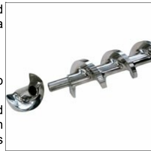
Tornillo de compresión abierto

Hemos adquirido una mapa cognitiva y un consecuente, profundo, patrimonio histórico de estas máquinas: todo esto nos permite de mejorar el nivel de las tecnologías y de poder afirmar que el nombre Braibanti es siempre, gracias también a nosotros, sinónimo de indestructibilidad.