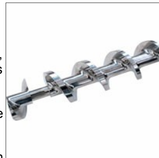
Tornillo de compresión cerrado