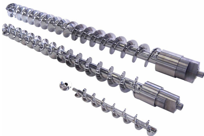
Tornillos de compresión