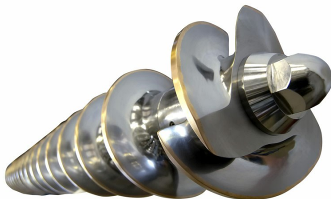
Tornillo de compresión