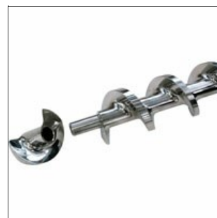
Détail vis de compression ouverte

Nous avons acquis une carte cognitive et, par conséquent, un patrimoine approfondi et historique de ces machines; tout cela nous permet d'apporter des améliorations technologiques de haut niveau , là où c'est nécessaire, et de pouvoir affirmer que le nom Braibanti est depuis toujours synonyme d'indestructibilité, et cela également grâce à nous.