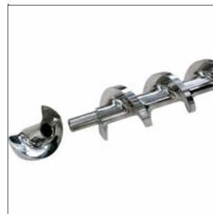
Détail vis de compression ouverte

Nous avons acquis une carte cognitive et, par conséquent, un patrimoine approfondi et historique de ces machines; tout cela nous permet d'apporter des améliorations technologiques de haut niveau , là où c'est nécessaire, et de pouvoir affirmer que le nom Braibanti est depuis toujours synonyme d'indestructibilité, et cela également grâce à nous.