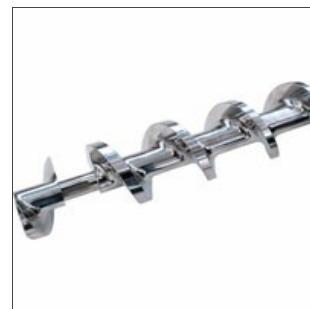
Dettaglio vite di compressione chiusa