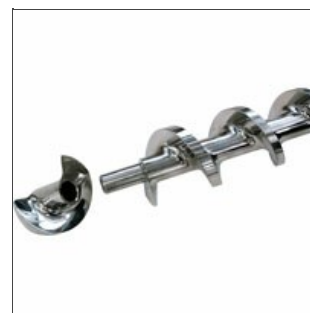
Dettaglio vite di compressione aperta

Abbiamo acquisito una mappa conoscitiva e un conseguente, profondo, patrimonio storico di queste macchine; tutto ciò ci permette di apportare dove necessario migliorie tecnologiche di alto livello e di poter affermare che la parola Braibanti è sempre, grazie anche a noi, sinonimo di indistruttibilità.