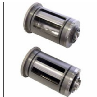
Esempio di capsulismi