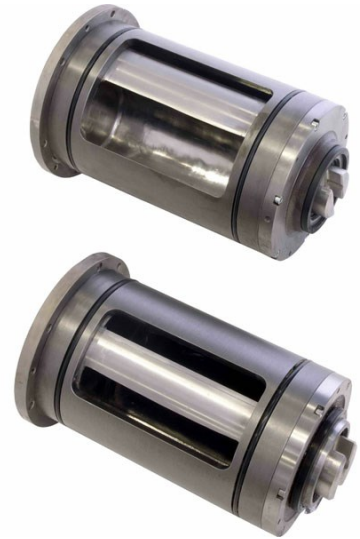
■ Esempi di capsulismi