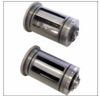
Esempio di capsulismi