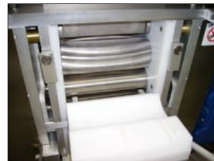
Sistema di gramolazione e calibrazione