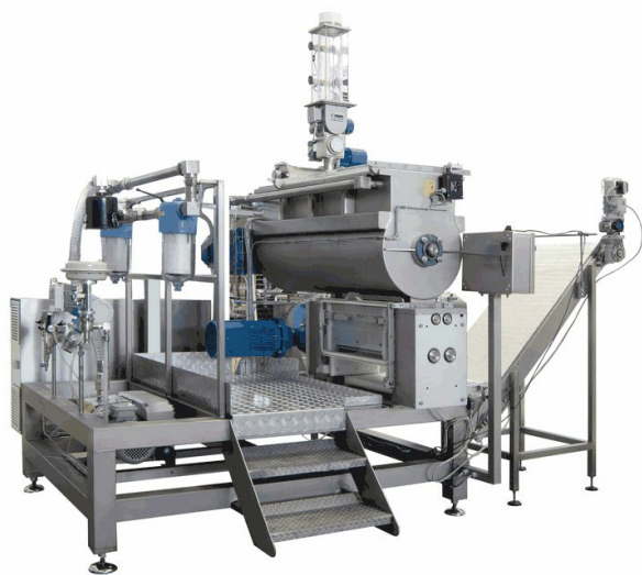
VSF TV/MIX con sistema automatico impasto