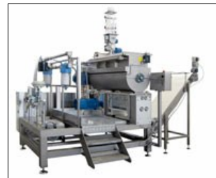
VSF TV/MIX con sistema automatico impasto