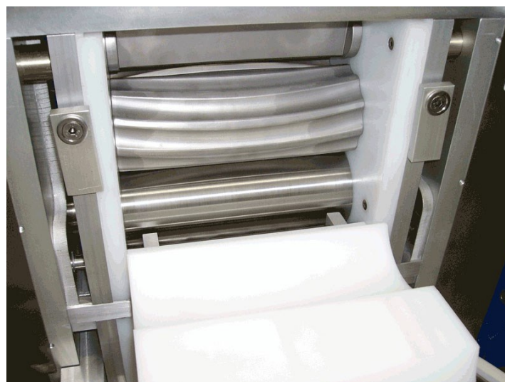
Sistema di gramolazione e calibrazione