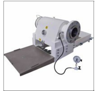
Cabezal para pasta corta