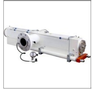
Cabezal para pasta larga

Realizamos revisiones a nuevo de cabezales/tubos difusores usados, en nuestro taller, en particular para los equipos Braibanti, que conocemos de hace más de treinta años y respecto de los cuales podemos brindar un servicio muy válido de asistencia y revisión, gracias a la aplicación de una tecnología más reciente.