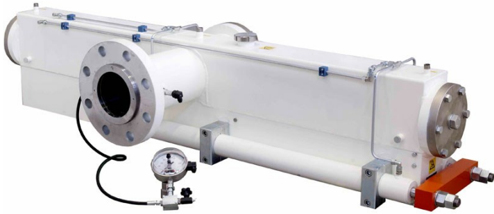
■ Testata per pasta lunga