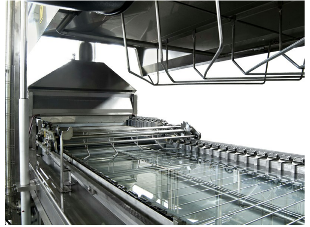
■ Detalle cocedor a barra