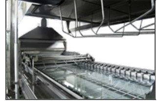
Detalle cocedor a barra