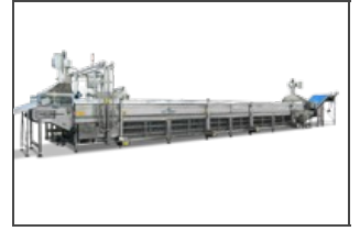
Cocedor a barra

Los cocedores a barra son la mejor solución para la cocción continua de la lámina en las líneas para platos pronti. Garantizan una cocción uniforme , precisión en el transporte y en las etapas de entrada y salida del producto de la máquina. Estos cocedores son adecuados al tratamiento de cualquier medida de la lámina y permite tiempos distinto de cocción.