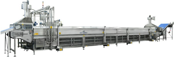
■ Cuiseur à tiges