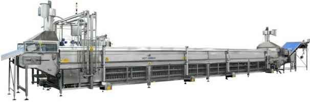
■ Cuocitore a tondini