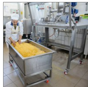
Cuve sur roues avec pâte