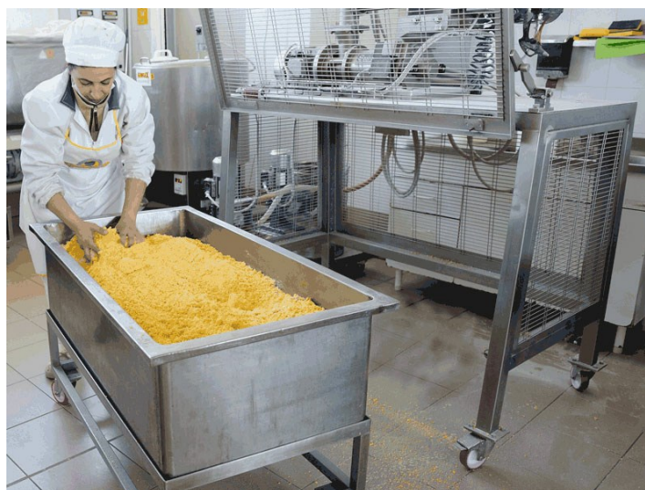
Cuve sur roues avec pâte