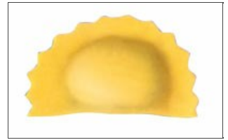
Mezzaluna a doppia sfoglia

Dispositivo di taglio e/o recupero sfridi; regolazione elettronica indipendente della velocità sfoglia.