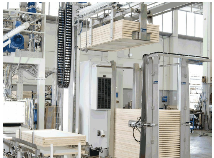
■ Robo XI: sistema robotizzato di fine linea