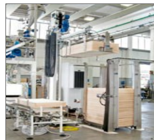
Robo XI: sistema robotizado de final de línea (válida alternativa al Robo-T)