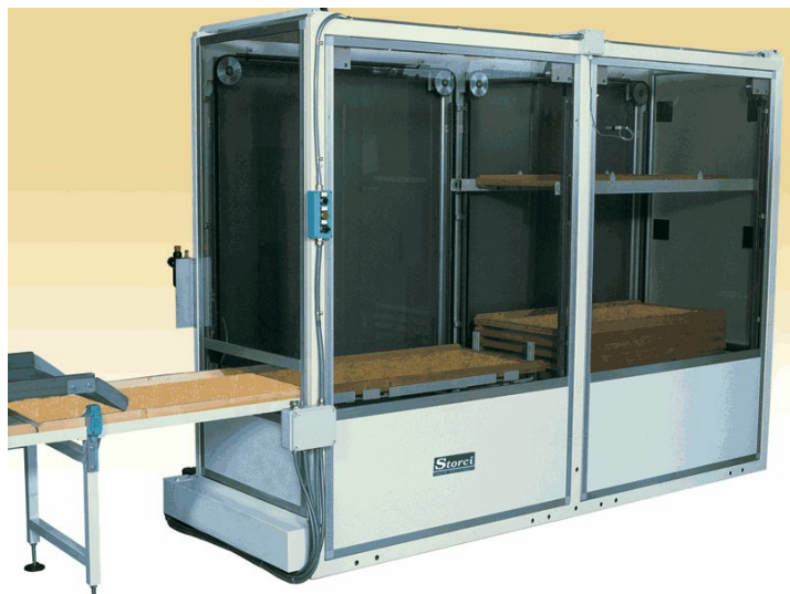
■ Apiladores bastidores Robo-T