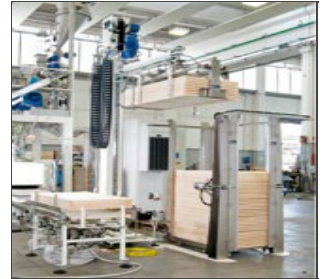
Robo XI: sistema robotizado de final de línea (válida alternativa al Robo-T)