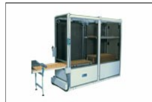
Apiladores bastidores Robo-T

Está equipado de una alarma que señala cuando el carro está completo y de paneles perimetrales con función de protección de seguridad. En alternativa está disponible el sistema robotizado Robo XI.