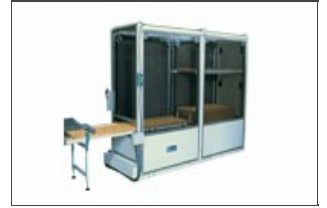
Apiladores bastidores Robo-T

Está equipado de una alarma que señala cuando el carro está completo y de paneles perimetrales con función de protección de seguridad. En alternativa está disponible el sistema robotizado Robo XI.