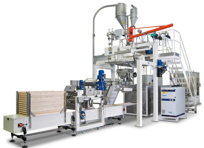
Ligne spéciale pour nids, lasagne, pâtes courtes et spéciales