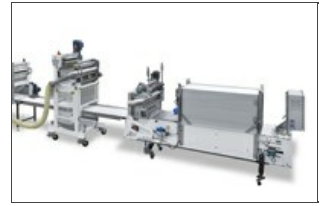
Formeuse de lasagne

Destinée à la moyenne et grande industrie alimentaire, elle peut être accouplée avec des presses et des rouleuses. Sa nouvelle conception, l'utilisation de nouveaux matériaux, les solutions techniques adoptées ainsi que la structure particulièrement solide ont permis de réaliser une machine robuste, facile à nettoyer, avec des exigences réduites en matière d'entretien.