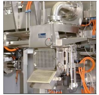
Vista cabeza circular