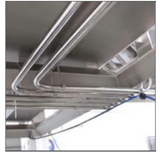
Particular protección con tubos en acero para cables eléctricos