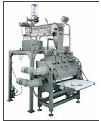
Applicazione Premix® su Beltmix

Attenzione alle imitazioni: non fatevi ingannare dai tentativi di imitazione del Premix® . Grazie ad una prova pratica sarà possibile testarne l'efficacia e l'autenticità. La nostra sala prove è sempre a disposizione, senza alcun impegno, per mostrare il funzionamento del Premix® utilizzando anche materie prime e ricette del cliente.