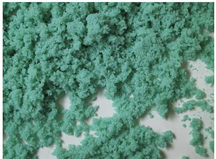
■ Impasto con colorante (blu di metilene)