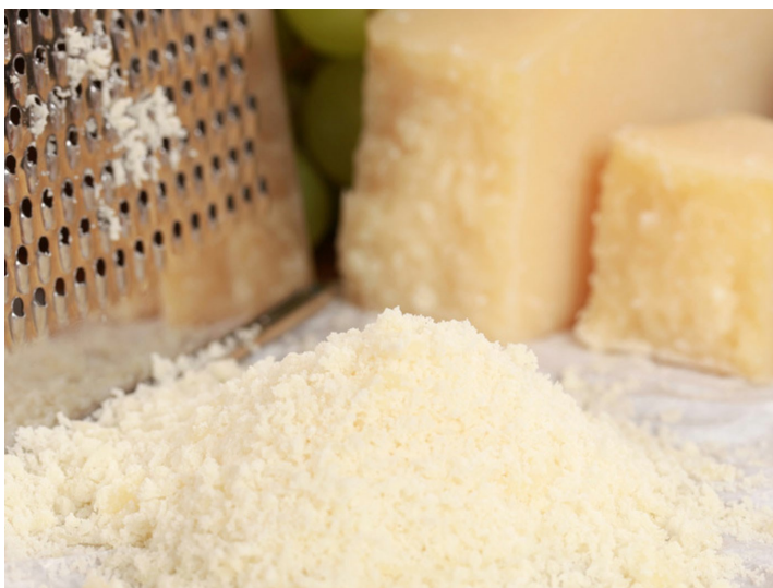
■ Parmigiano Reggiano

Grazie alla recente collaborazione con la società BS di Parmasono nate soluzioni innovative e creative per la preparazione di lasagne e cannelloni pronti per il consumo. Da oltre 30 anni BS opera con competenza e affidabilità nei principali mercati dei piatti pronti, fast food, gelati e dolciumi. Sono questi i prodotti a valore aggiunto che ti permettono di guadagnare e noi ti offriamo la soluzione personalizzata migliore.