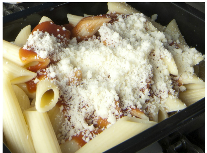
■ Formaggio grattugiato su pasta