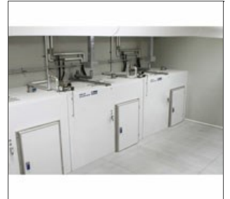
Celda de secado a 3 y 4 carros (modelo no estandard)