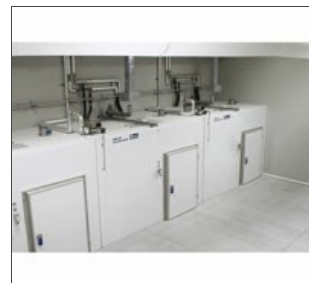
Celle di essiccazione