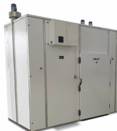
Cella di essiccazione HW