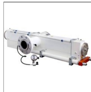
Testata per pasta lunga

Realizziamo revisioni a nuovo di testate/tubi diffusori usati, presso la nostra officina, in particolare per gli impianti Braibanti , che conosciamo da più di trent'anni e rispetto ai quali possiamo fornire un validissimo servizio di assistenza e revisione , grazie all'applicazione di una tecnologia più recente.