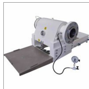
Testata per pasta corta