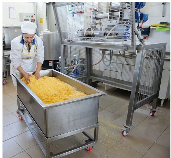
Tanque sobre ruedas y masa