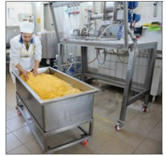
Tanque sobre ruedas y masa